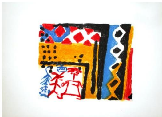
„Unter der Sonne Senegals“. Original-Grafik v. Mag.Art. Lotte Ranft (37x54cm). € 220,- Porto: € 4,81

Bestellung: Vorauszahlung unter dem Betreff: Spende Grafik, Spende CD, Spende Nüsse.